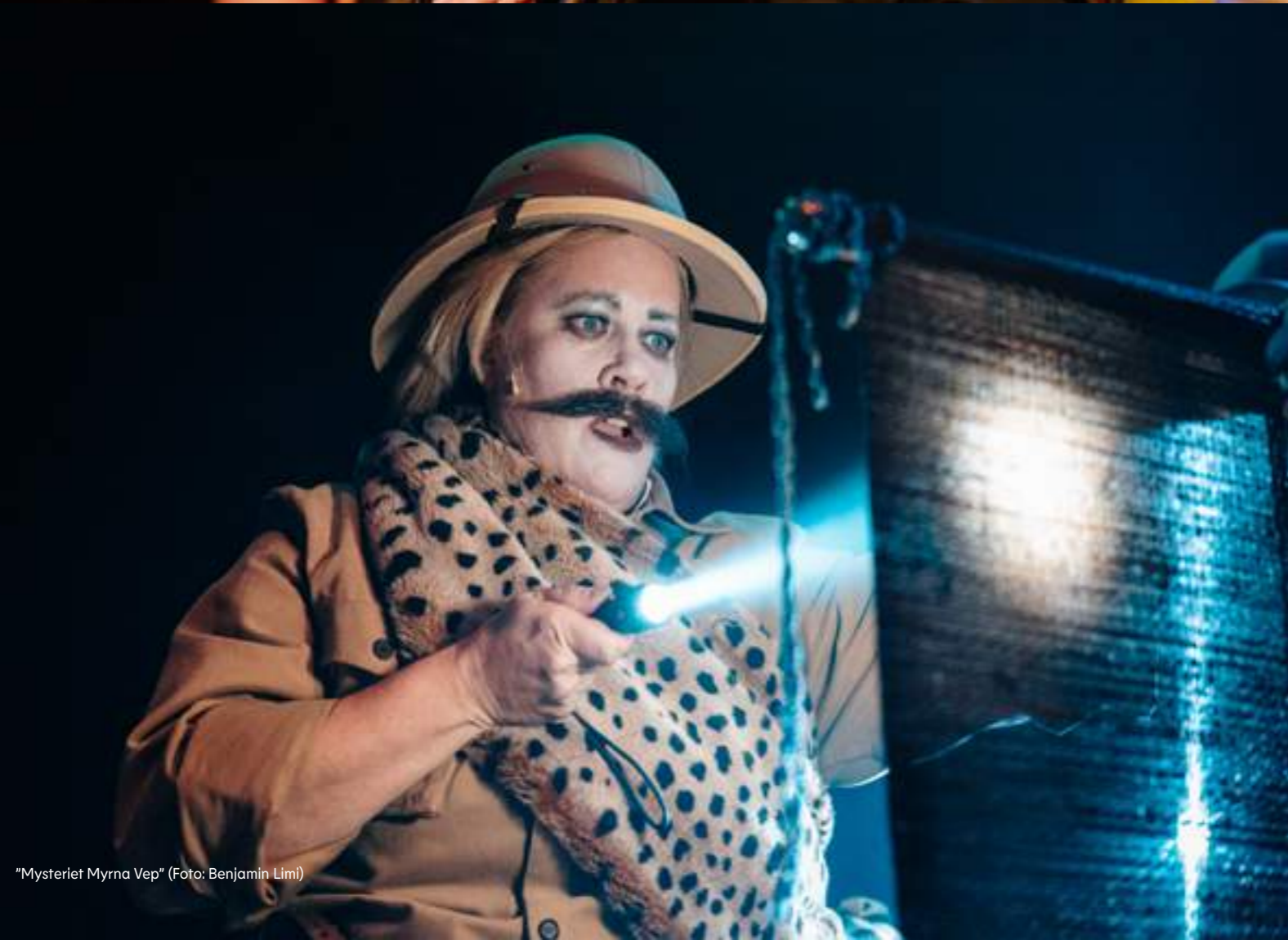
"Mysteriet Myrna Vep"