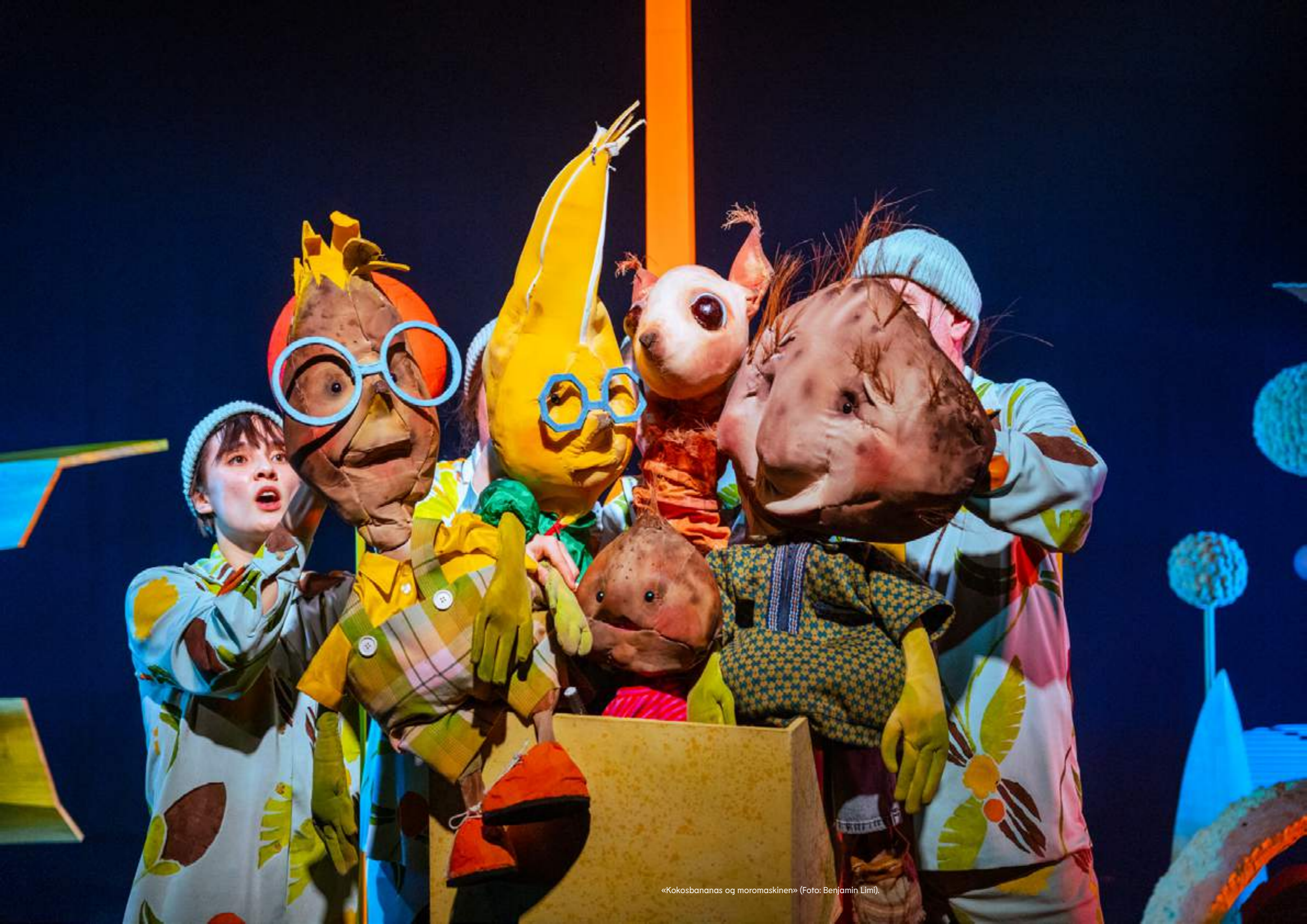
«Kokosbananas og moromaskinen».