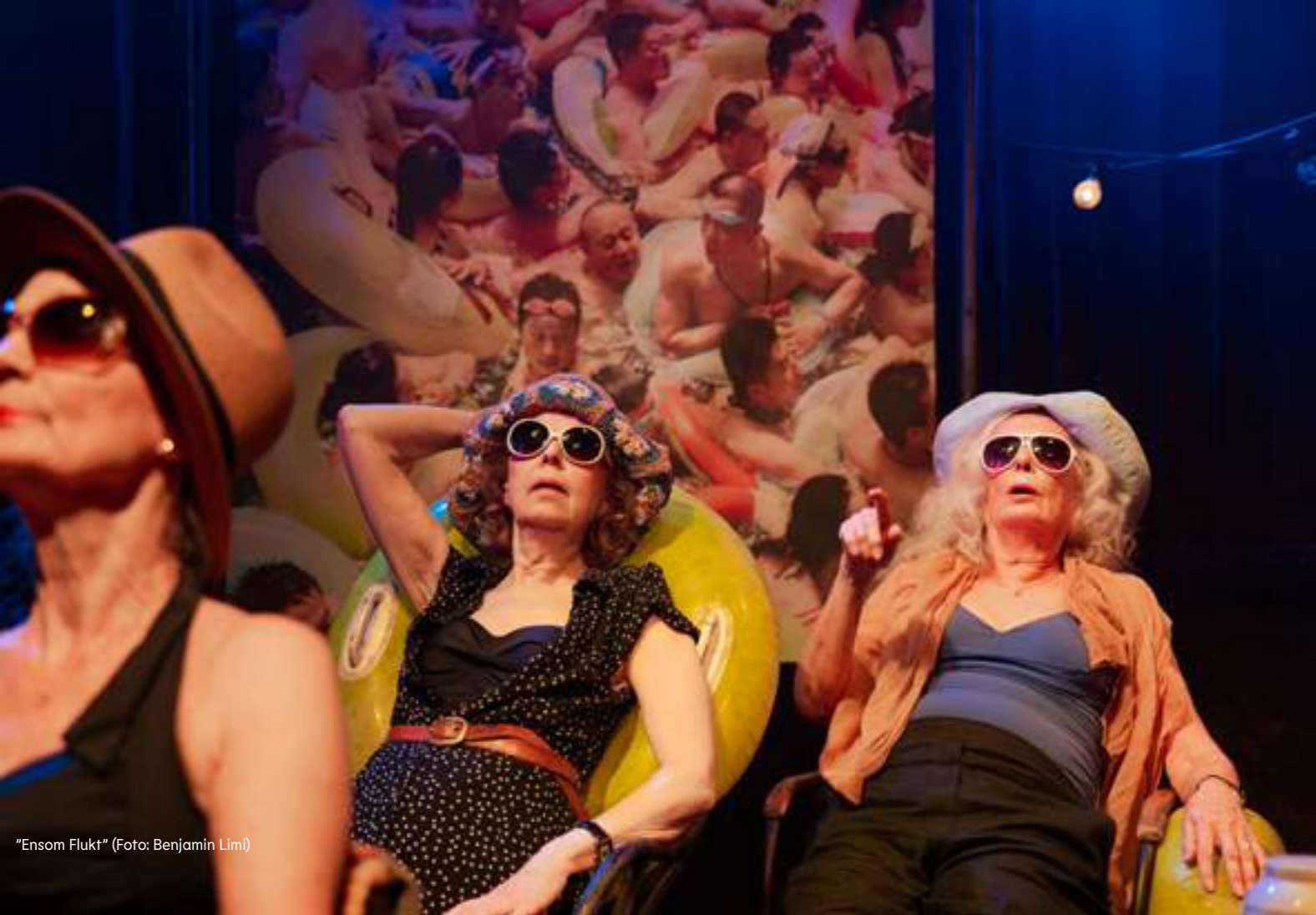
"Ensom Flukt"