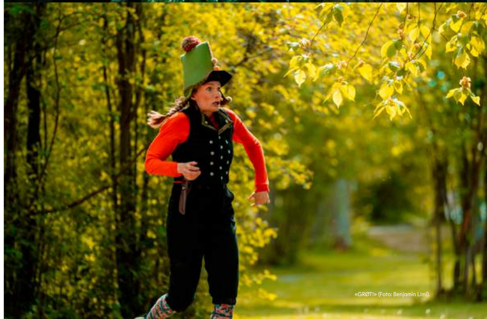
«GRØT!» (Foto: Benjamin Limi).