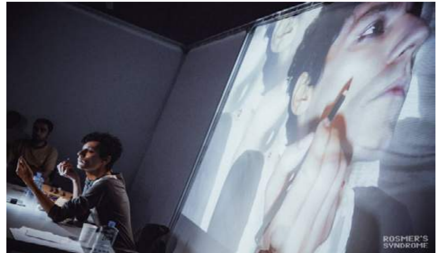
«Rosmer's Syndrome» av Davoud Zare fra Iran. Ibsen Scope Grant-vinner 2021