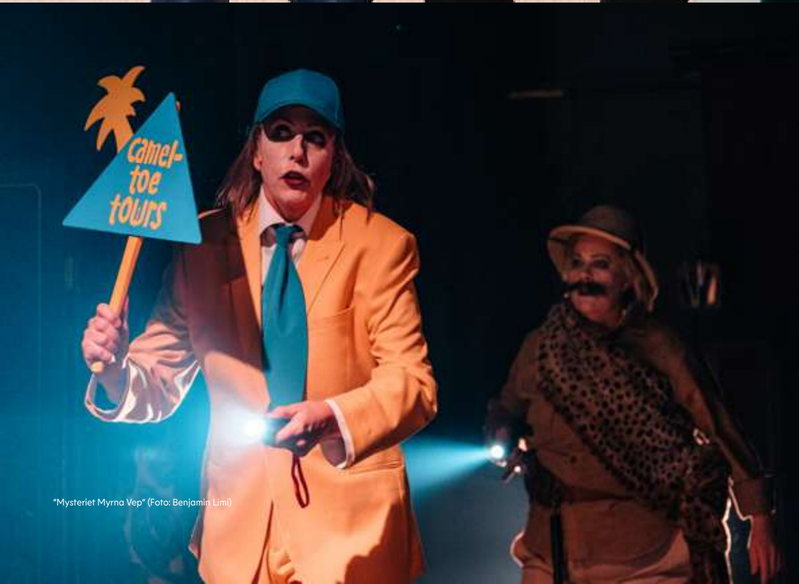
"Mysteriet Myrna Vep"