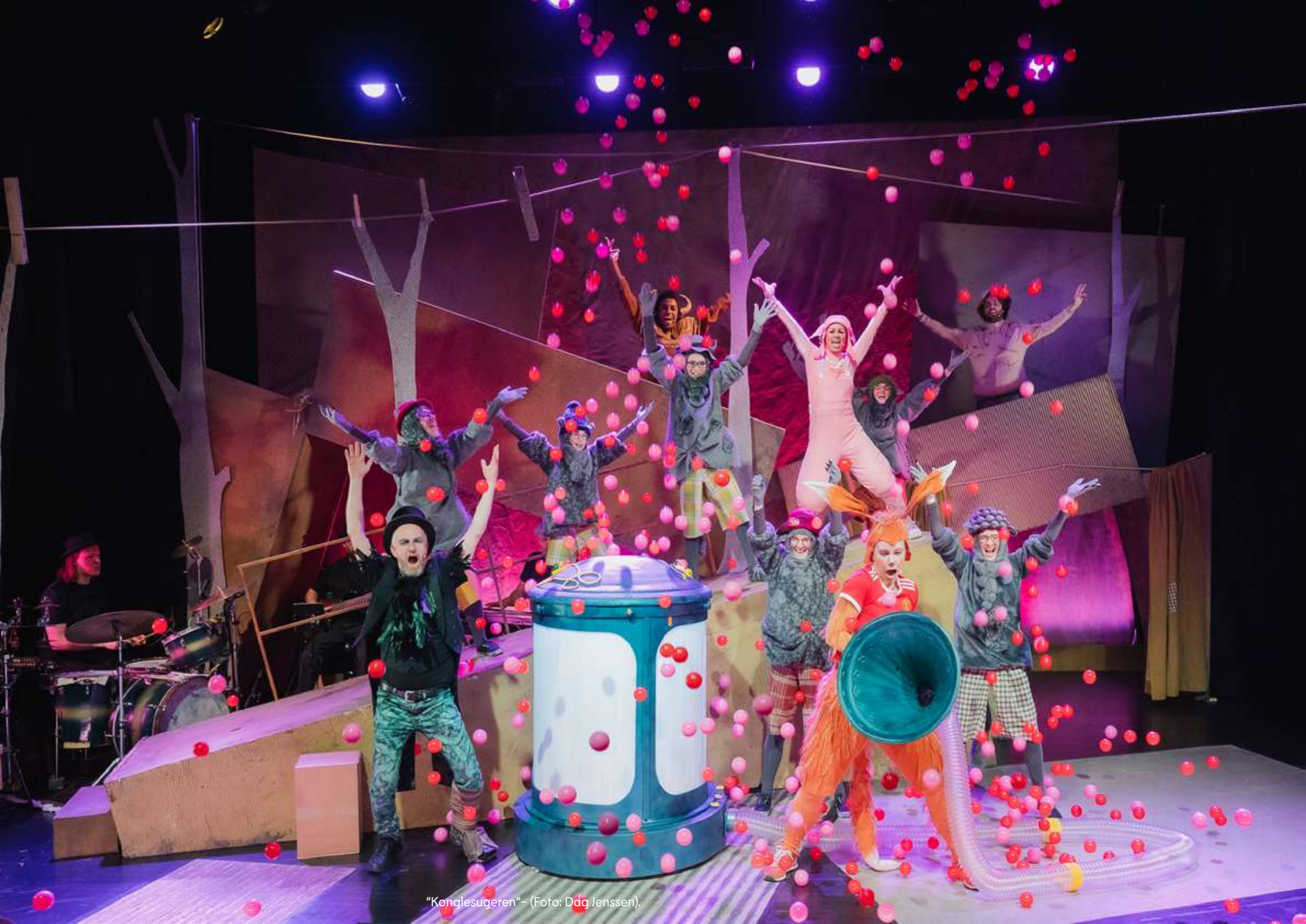
"Konglesugeren" - (Foto: Dag Jenssen).