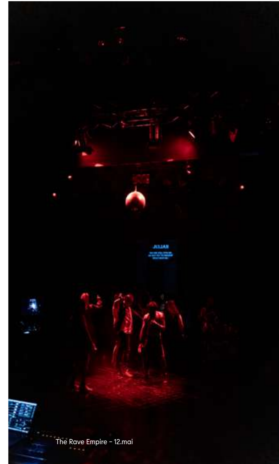
The Rave Empire - 12.mai

Det arbeides kontinuerlig med å utvikle arbeidet i Ibsen Scope med fokus på å være en viktig arena for Ibsen og scenekunst i Norge og verden. Samarbeid og co-produksjoner er viktig for utviklingen videre, og Ibsen Scope Grants har en sentral rolle i å vise Ibsens aktualitet i et lokalt og globalt perspektiv.