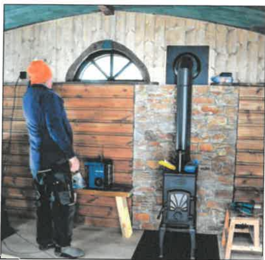
INTERIØR: Snart er hytta «Torv» ferdig.

BLOGGET: Sophie Elise blogger om oppholdet i Sannidal